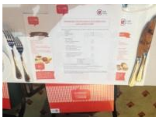
8º Congreso Mundial de Prevención en Diabetes y sus Complicaciones